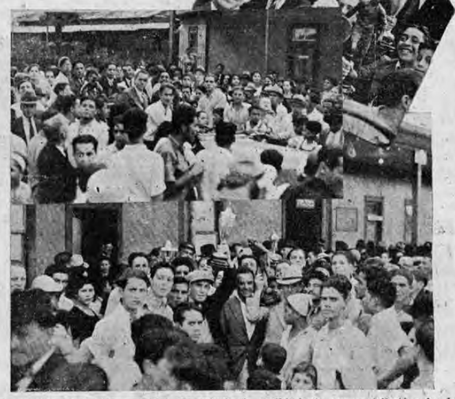
Recoge el grabado tres aspectos del entusiasta recibimiento que se tributó a los integrantes del equipo "La Libertad"

Cordial recibimiento se tributó ayer a los miembros del equipo "La Libertad" a su regreso de México